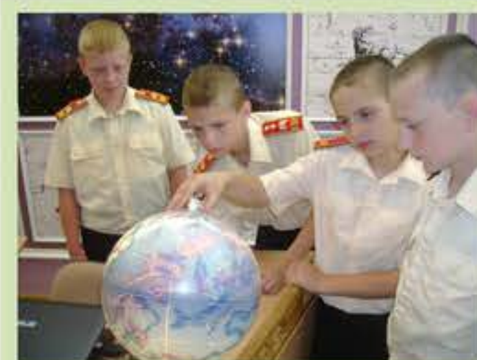
Вот оно какое – звёздное небо!

Еще одно незабываемое путешествие осталось в памяти – экскурсия на автозавод. Ведь только там можно было увидеть все модели, которые выпустил завод с первых дней работы на Ульяновской земле. А еще в машину можно было залезть и почувствовать себя настоящим водителем. Необычные впечатления от разговора с настоящим испытателем УАЗов долго были