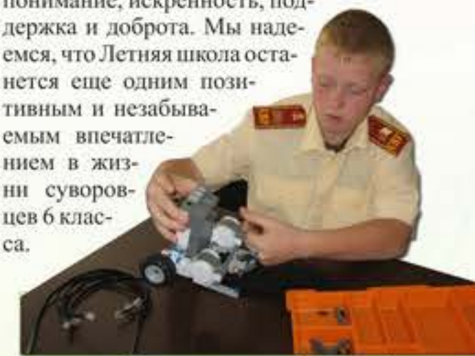
Вот он – первый робот!

Именно так, совершая реальные и виртуальные путешествия, информашками были освоены новые пространства, получены новые знания и практические умения. Суворовцы смогли узнать что-то новое о себе и своих возможностях. Для всех участников объединения «Информашки-2» главными сокровищами остаются дружба, воспоминания, успехи, творчество, понимание, искренность, поддержка и доброта. Мы надеемся, что Летняя школа останется еще одним позитивным и незабываемым впечатлением в жизни суворовцев 6 класса.