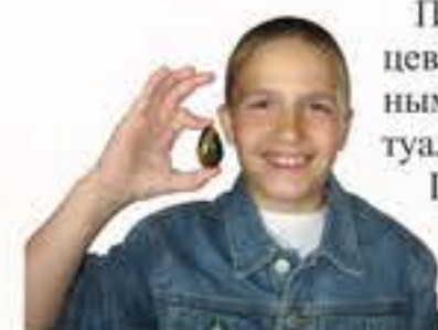
Красота своими руками

Лошади никого не оставили равнодушными. Особенности строения лошади, где у нее локоть и где колено, как за ними ухаживать – все это суворовцы смогли узнать в центре иппотерапии «Лучик». Здесь познакомились с деятельностью, направленной на оздоровление детей и сами смогли оказать посильную помощь.