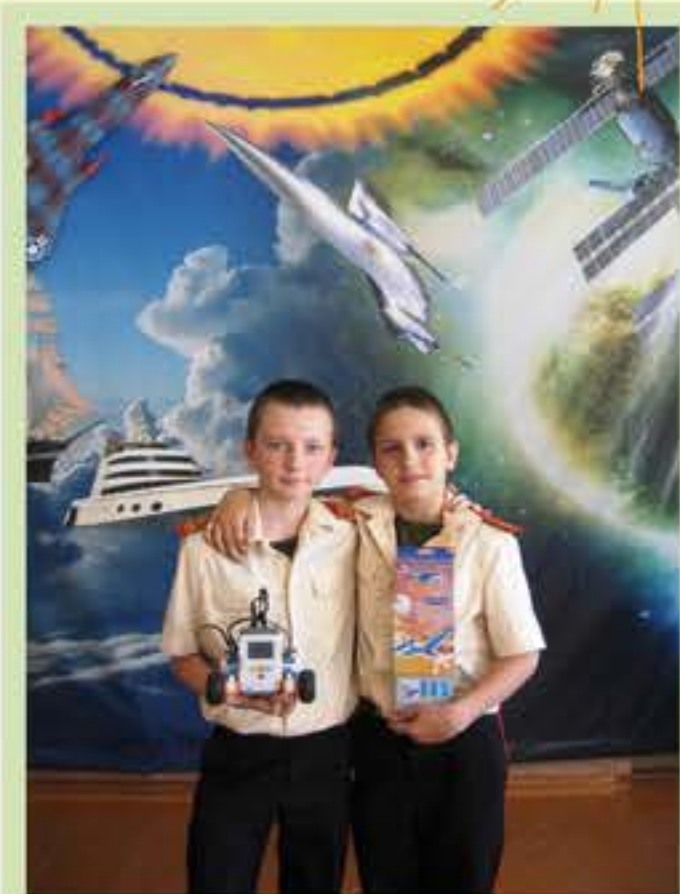
Наш робот победитель

посетили областной центр детского и юношеского технического творчества, где на мастер-классе были собраны первые роботы, оснащенные специальными световыми датчиками и проведены испытания на специальном поле. Затем на базе суворовского училища были собраны и отлажены роботы-карусели, стеклоочистители, светофоры, системы включения света в подъезде. Для того чтобы робот перемещался или совершал другие действия, требовалось составить программу на специальном языке. Наши «шестиклашки» справились и с этим испытанием!