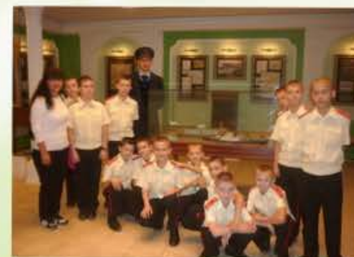
В музее «Симбирское купечество»