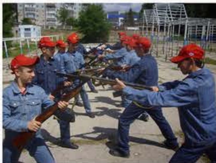
Отработка навыков атаки и защиты на базе училища

В процессе изготовления необходимого спортивно-тренировочного инвентаря параллельно мы начали специализированную физическую подготовку воинского рукопашного боя. Для этого мы использовали изготовленные во время учебного года макеты сапёрных лопаток, штык ножей и взятые в пользование на ОД «Физкультура» макеты автоматов со штык ножами. Кроме того, суворовцам были даны уроки элементарного рукопашного боя.