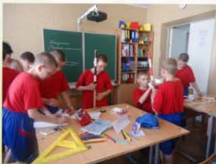
Подготовка инструментов к практической работе

Но не только практической геометрией занимались мы в течение 14 летних дней, жарких и не очень. Ещё одна идея получила своё воплощение в ходе реализации намеченного: научи других тому, что умеешь сам. Дело в том, что удивительные современные дети, очень развитые с точки зрения использования компьютерной техники, достаточно беспомощны, когда необходимо что-то изготовить своими руками: нарисовать карандашами или красками, слепить из пластилина, склеить из бумаги или картона. Их этому надо учить! Значит, решила я, мы будем