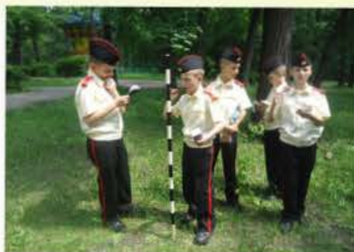
Практическая геометрия – это занимательно и увлекательно!

В первую очередь, в план работы объединения «Реальная математика» я включила задачи, связанные с измерениями на местности. На подготовительных занятиях перед каждой практической работой мы обсуждали необходимость проведения измерительных работ на местности, вспоминали, люди каких профессий решают эти