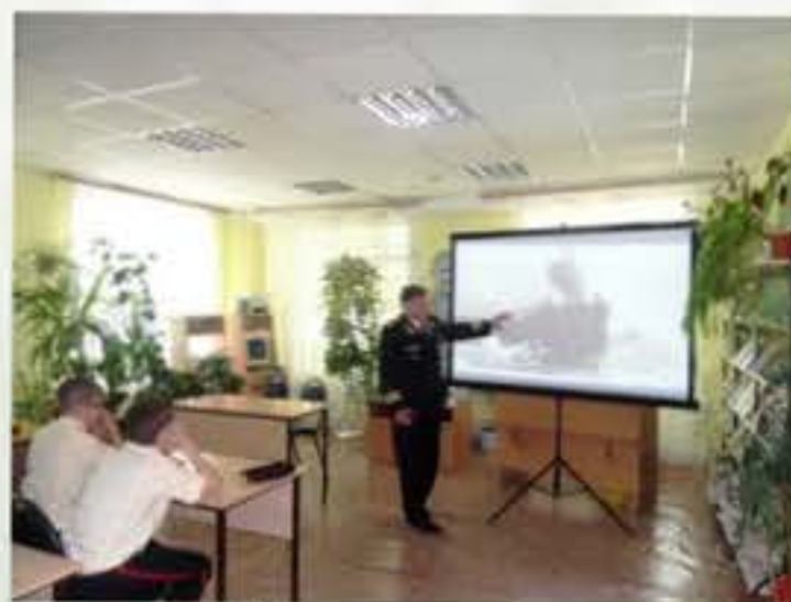
Встреча с моряком

В процессе общения суворовцы поняли, что представители самой героической и романти-