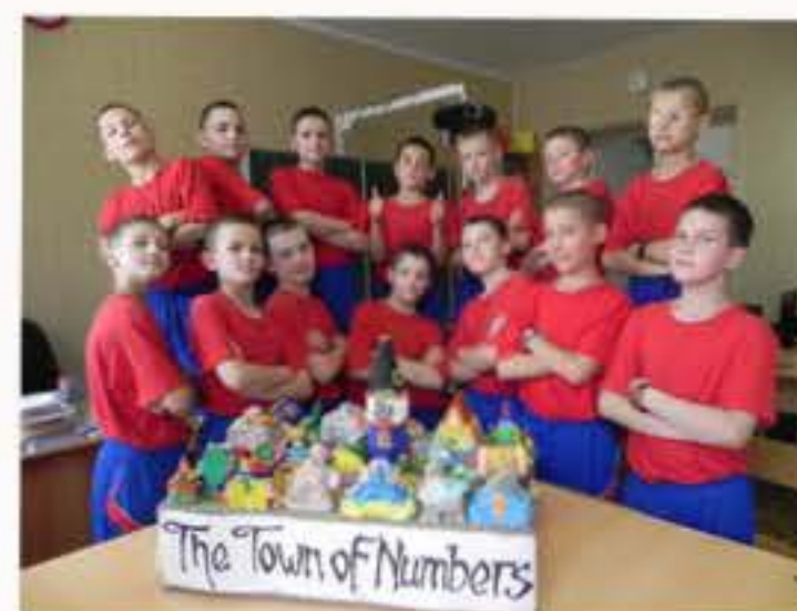
Мы это сделали (Город Чисел и Фигур из солёного теста)

создавать Город Чисел и Фигур (реальная математика воочию) и лепить его из ... солёного теста. Задумано – сделано. Не всё сразу получалось, но терпение и труд всё перетрут, и потихоньку наш красивый и очень математический город получил свои очертания, а его доблестные и упорные строители учились создавать интересные объёмные скульптурные фигурки своими руками.