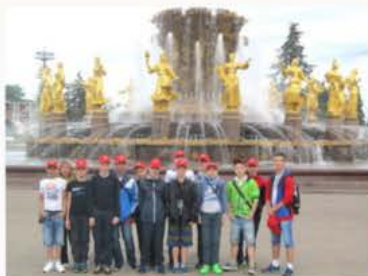
Путь был не близкий. Через столицу нашей Родины

Если читать карту нашей страны слева на право, то ее началом окажется берег Балтийского моря, самая западная точка границы России. Здесь на самом краю земли Российской в окружении стран Евросоюза стоит Калининград – город с особой исторической судьбой.